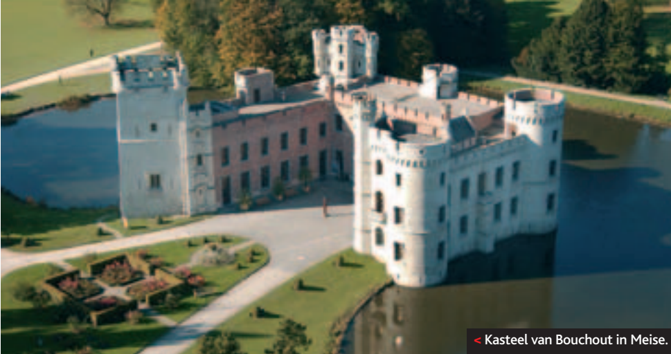
< Kasteel van Bouchout in Meise.