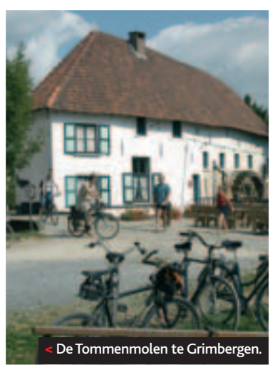
< De Tommenmolen te Grimbergen.

De ouverture van de tocht illustreert perfect de afwisseling qua decor die voor heel de rit geldt. Starten in het stadscentrum, klimmen door het Paolapark met Franse tuinen (500 meter aan 8 %), even langs het Kleurt-jedag-plein van VTM en opnieuw bergop (10 %) door een open vlakte met een schitterend panorama. Die inspanning wordt beloond met een afdaling tot de barokke abdijkerk midden de stemmige dorpskern van Grimbergen. De volkssterrenwacht MIRA en het abdijbiermuseum zijn hier de belangrijkste trekpleisters.